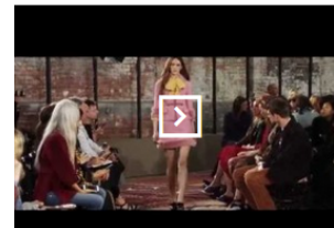
CURTA DA COLEÇÃO RESORT 2016 DA GUCCI